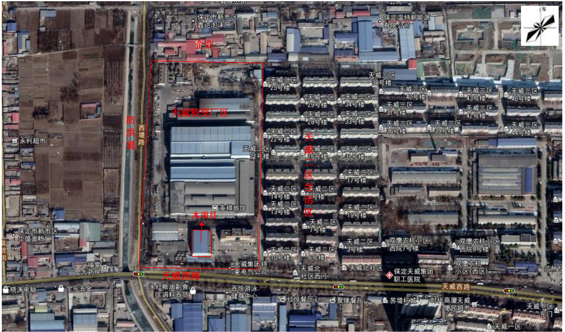
附图3 特变厂区周边关系图