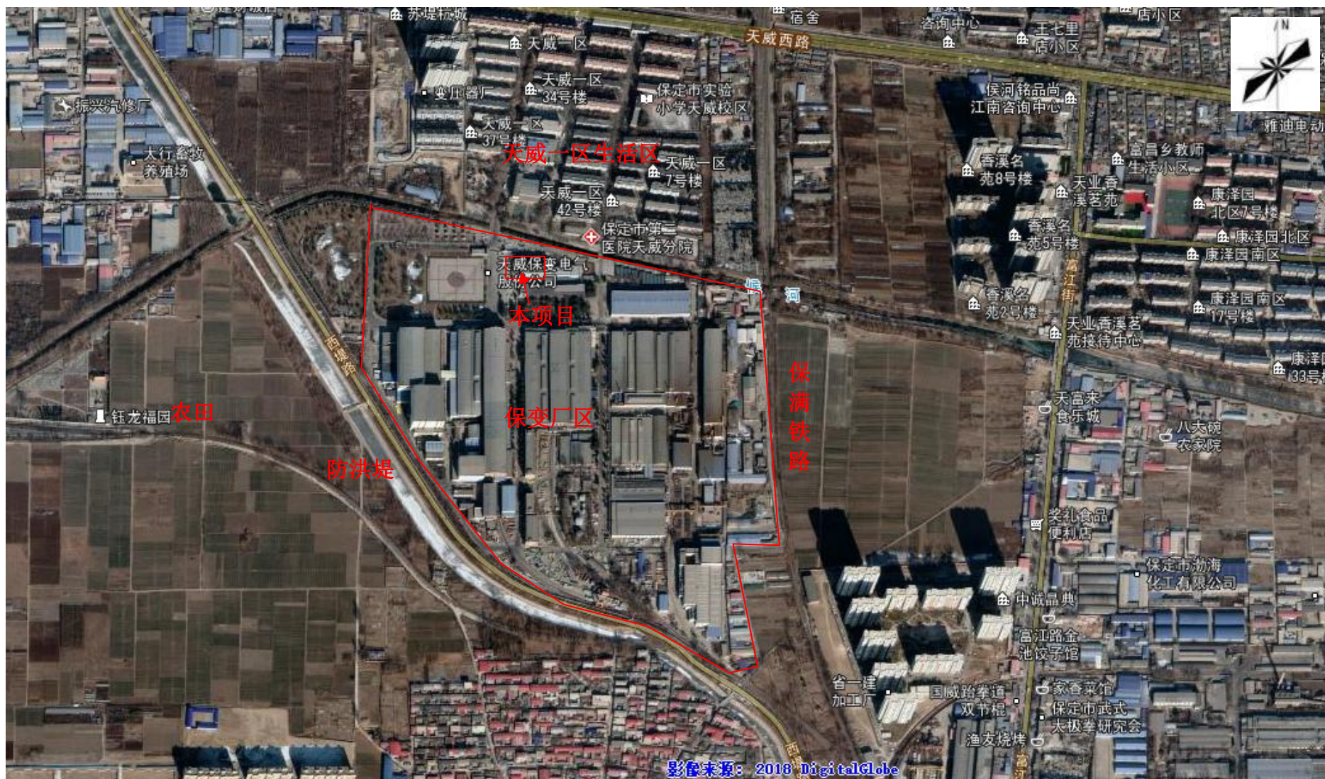
附图2 保变厂区周边关系图